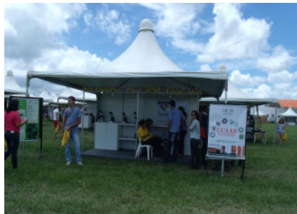
Stands do CCAAB no II Fórum Internacional 20 de novembro