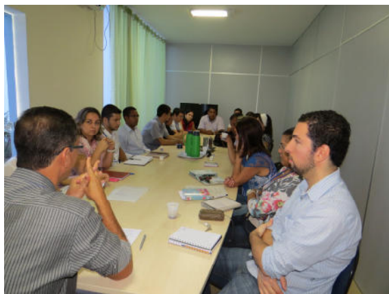
Reunião com gestores e servidores técnico-administrativos