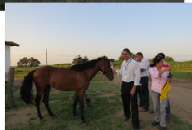
Visitas aos setores de campo