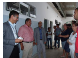
Sede do Setor de Engenharia Florestal