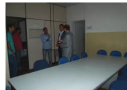
Sede da Fazenda Experimental do CCAAB