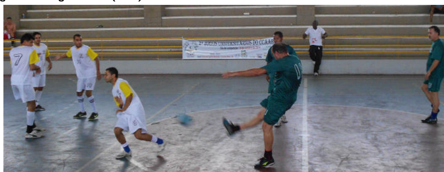
Docentes + Téc. Administrativos x Pós-Graduação (0 x 2)