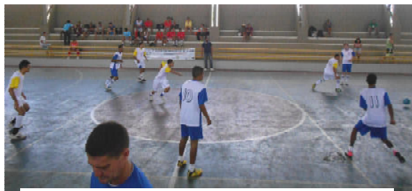
Biologia x Pós-Graduação (1 x 0)