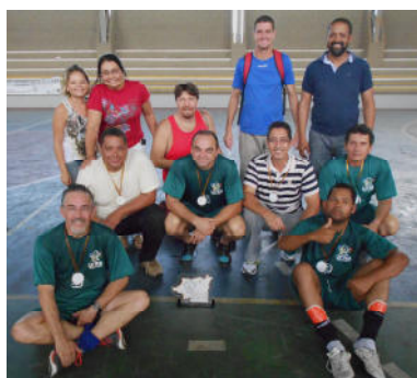
3º Lugar - Docentes + Técnico- Administrativos