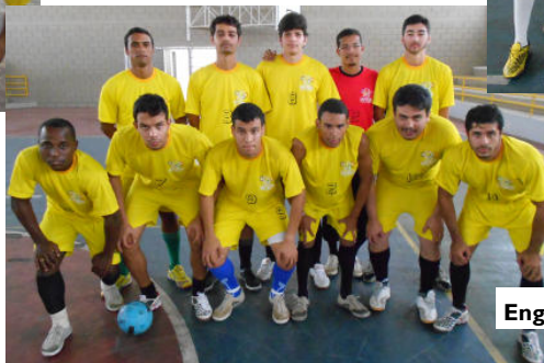
Engenharia de Pesca