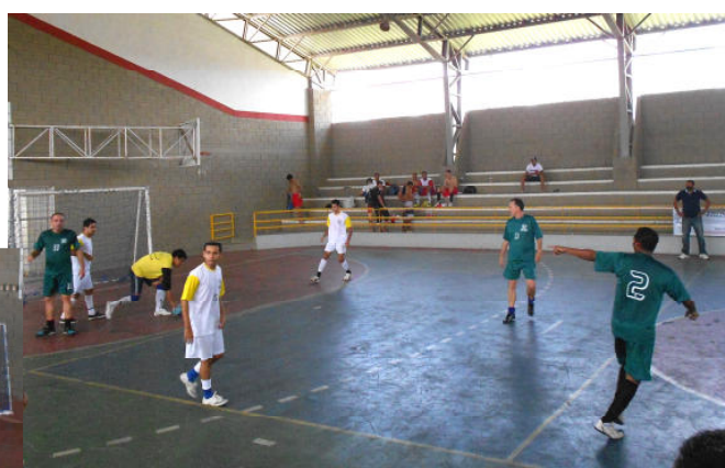
Docentes + Tec. Administrativos x Pós-Graduação