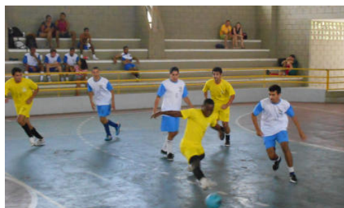
Eng. de Pesca x Tec. Gestão de Cooperativas (3 x 3)