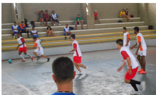
Eng. Florestal x Medicina Veterinária (4 x 1)