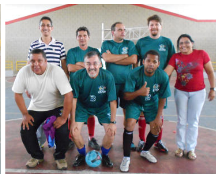
Docentes + Técnico-Administrativos