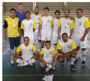
2º Lugar - Pós-Graduação