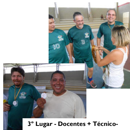
3º Lugar - Docentes + Técnico- Administrativos