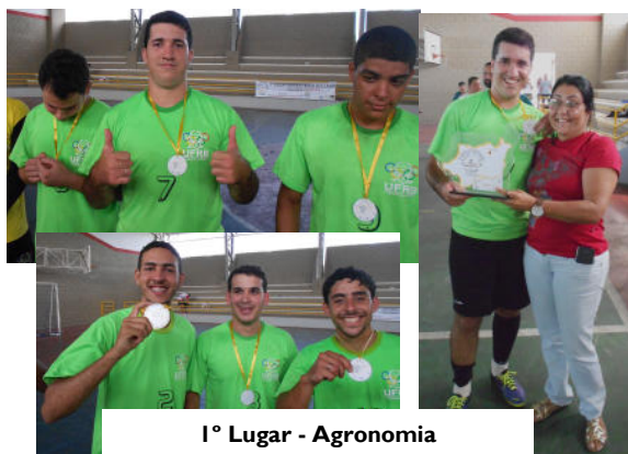
1º Lugar - Agronomia