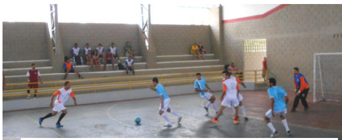
Zootecnia x Medicina Veterinária [(2 x 2) / Pênaltis (1 x 0)]