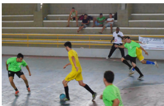
Eng. Pesca x Agronomia (0 x 0)