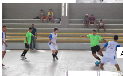
Agronomia I x Agronomia II