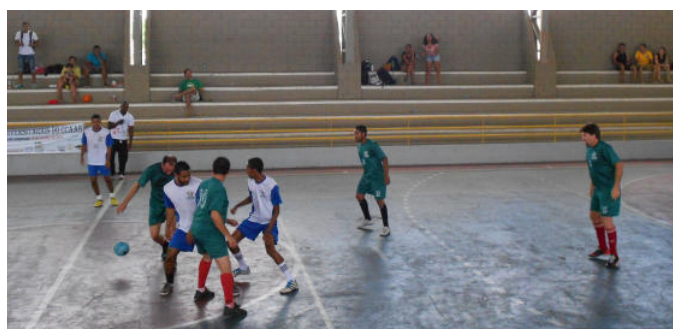
Docentes + Tec. Administrativos x Biologia (2 x 0)