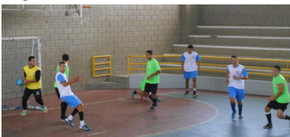
Agronomia x Tec. Gestão de Cooperativas (3 x 2)