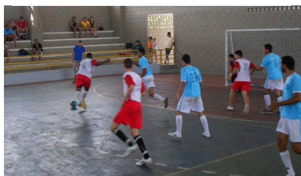
Eng. Florestal x Zootecnia (4 x 2)