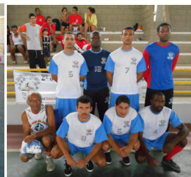
Tecnologia em Gestão de cooperativas