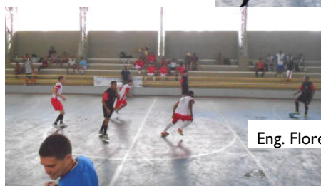
Eng. Florestal I x Eng. Florestal II