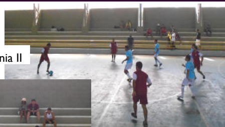
Zootecnia I x Zootecnia II