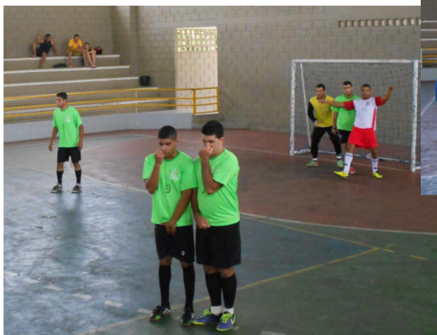
Agronomia X Engenharia Florestal

Na semi-final obteve-se os seguintes resultados: Agronomia X Engenharia Florestal (5 x 1); Pós-Graduação X Pós-Graduação (3 x 0).