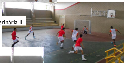
Med. Veterinária I x Med. Veterinária II