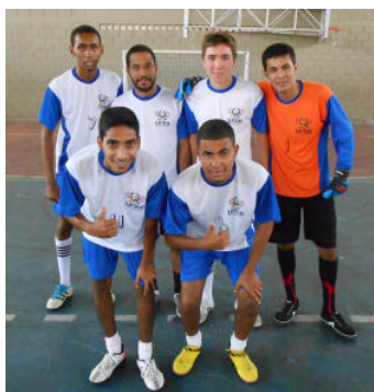
Bacharelado em Biologia