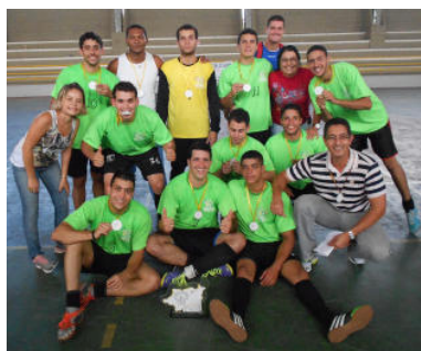
1º Lugar - Agronomia