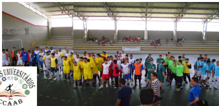
Abertura Oficial do evento

Após a abertura do evento, seguiu-se as disputas entre os seguintes times: Agronomia X Tec. Gestão de Cooperativas (3 x 2); Zootecnia x Med. Veterinária [(2 x 2) / Pênaltis (1 x 0)]; Bach. em Biologia x Pós-Graduação (1 x 3); Eng. de Pesca x Tec. Gestão de Cooperativas (3 x 3); Eng. Florestal x Med. Veterinária (4 x 1); Docentes + Téc. Administrativos x Biologia (2 x 0); Eng. de Pesca x Agronomia (0 x 0); Eng. Florestal x Zootecnia (4 x 2); Docentes + Téc. Administrativos x Pós-Graduação (0 x 2).