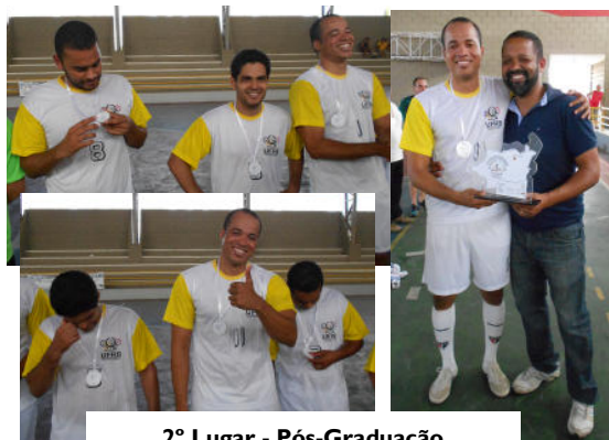
2º Lugar - Pós-Graduação