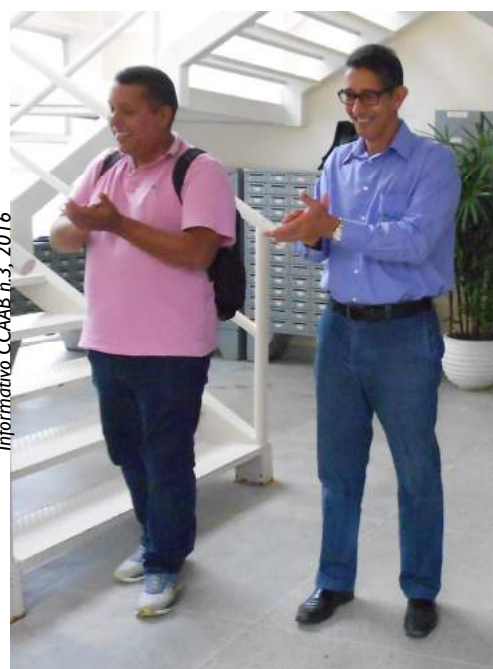
Informativo CCAAB n.3, 2016