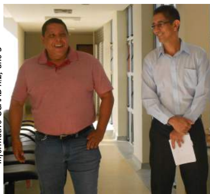
Informativo CCAAB n.2, ano 3