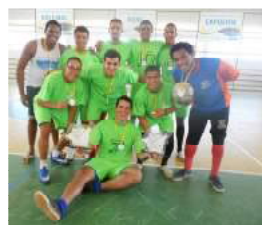
1º Lugar - Agronomia I