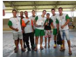
3º Lugar - Agronomia