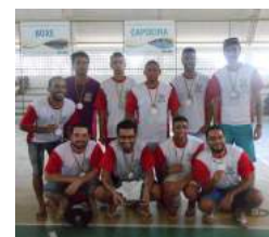
3º Lugar - Engenharia de Pesca