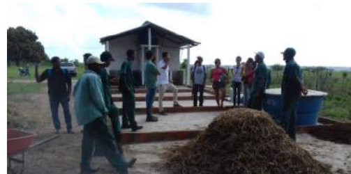
Unidade de Produção de Compostos Orgânicos - Estação Agroecológica