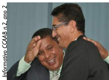
Informativo CCAAB n.2, ano 2