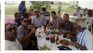
Café da manhã em comemoração ao Dia do Servidor Público - 24 de outubro de 2014