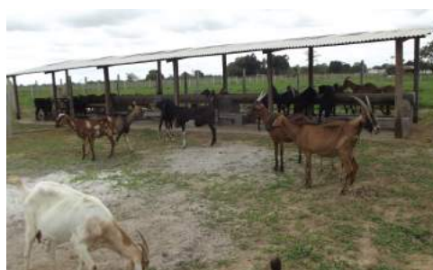
Curral de alimentação para setor de Caprinocultura