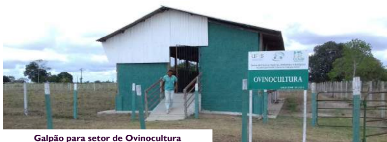
Galpão para setor de Ovinocultura

Durante a duração do projeto várias melhorias foram desenvolvidas na Fazenda Experimental e as prestações de contas podem ser verificadas nas Edições do Boletim Técnico da Fazenda Experimental do CCAAB ( www.ufrb.edu.br/boletimfazendaccaab ) - ISSN 2525-7889.