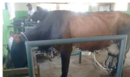
Reabilitação da Sala de Ordenha