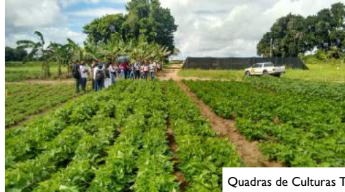
Quadras de Culturas Temporárias/Anuais