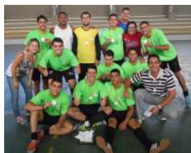
1º Lugar - Agronomia