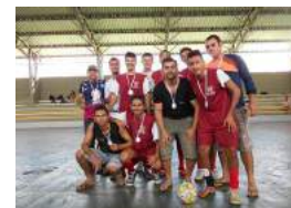
4º Lugar - Zootecnia