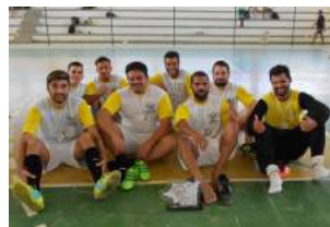
2º lugar - Engenharia de Pesca