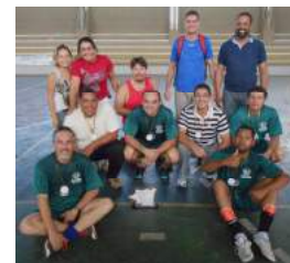
3º Lugar - Docentes + Técnico-Administrativos