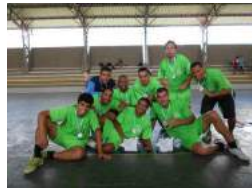
2º Lugar - Engenharia Florestal