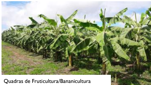
Quadras de Fruticultura/Bananicultura