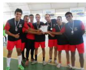
2º Lugar - Medicina Veterinária