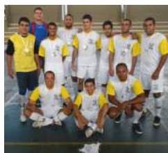
2º Lugar - Pós-Graduação