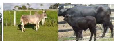
Diversificação dos Rebanhos