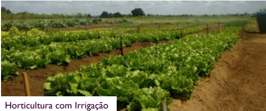
Horticultura com Irrigação