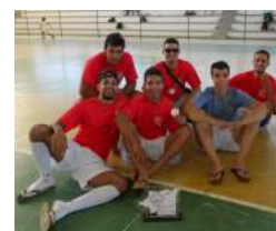
3º lugar - Medicina Veterinária