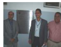
Sede do Setor de Engenharia Florestal