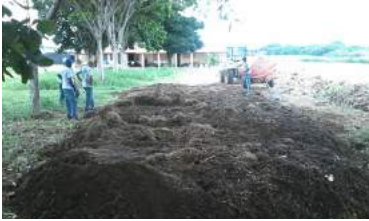
Área de produção de Compostos Orgânico - Campo de Exp. Vegetal