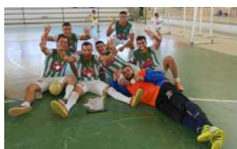
1º lugar - Agronomia I