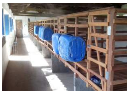
Readequação de instalação para experimentos