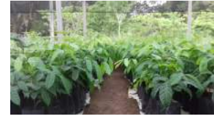
Viveiro para produção de mudas florestais, frutíferas e ornamentais