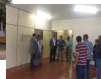
Sede da Fazenda Experimental