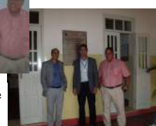
Sede da Fazenda Experimental do CCAAB