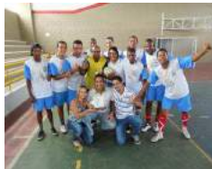
1º Lugar - Técnico-Administrativos