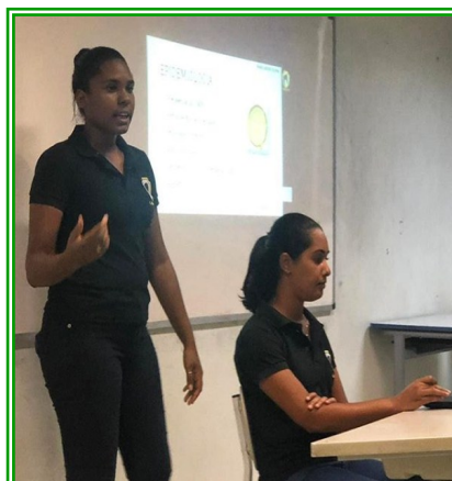
Figuras 1 e 2 – Discentes integrantes do grupo apresentando seminários em reuniões semanais.