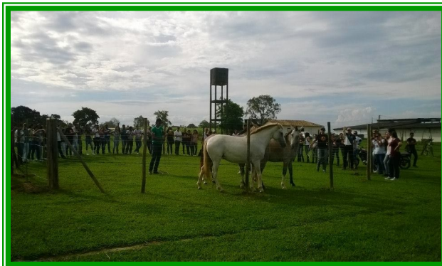
Figuras 10 e 11 – Integrantes da comissão organizadora do I EBAH. Curso prático de Horsemanship realizado no I EBAH .

Dessa forma, o CABALLUS tem a maior satisfação em ser um dos grupos de estudos que iniciou junto com o curso de Medicina Veterinária da UFRB e de ter participado na formação de diversos profissionais que seguiram carreira na Hipiatria. Isso nos impulsiona a buscar sempre o melhor para os nossos integrantes, os melhores profissionais, as melhores formas de aprendizado, a fim de proporcionar o mais elevado conhecimento aos futuros médicos veterinários e zootecnistas da Universidade Federal do Recôncavo da Bahia.