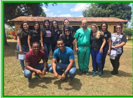
Figuras 3 e 4 – Discentes integrantes do grupo em visita técnica à Clínica do Rancho (primeira foto) e a leilões no Haras MAP (segunda foto).

As visitas técnicas permitem acesso à rotina diária da vida prática do Médico Veterinário em diversas áreas da medicina equina, entre elas a reprodução, a clínica e a cirurgia, para os integrantes do CABALLUS. Oportunidade em que os discentes conhecem o mercado de trabalho e podem vivenciar o que é compartilhado em sala de aula pelos docentes, além de acompanhar a rotina de um Haras e de um Hospital especializado.