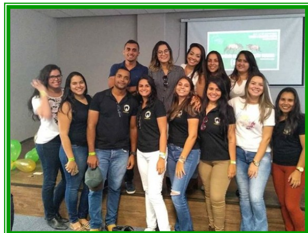
Figura 7 – Discentes integrantes do grupo em participação no 1º SIMAEQ na UNIFACS em Salvador.

Os integrantes do grupo de estudos são constantemente incentivados a participarem de eventos acadêmicos como simpósios, congressos e palestras direcionados à hipiatria na busca de novos saberes. Objetivando a atualização no que há de melhor e mais avançado nas pesquisas médicas e assim, se capacitar cada vez mais para o mercado de trabalho.