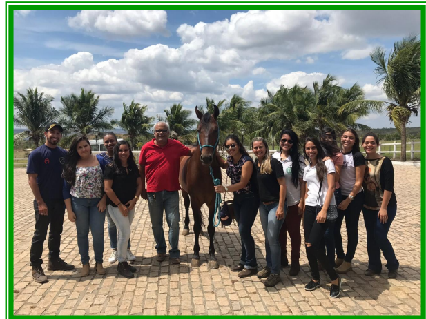
Figuras 5 e 6 – Discentes integrantes do grupo em visita técnica ao Haras Pamplona.

Os integrantes do grupo de estudos são constantemente incentivados a participarem de eventos acadêmicos como simpósios, congressos e palestras direcionados à hipiatria na busca de novos saberes. Objetivando a atualização no que há de melhor e mais avançado nas pesquisas médicas e assim, se capacitar cada vez mais para o mercado de trabalho.