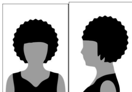
Figura 01 - Modelo de foto frontal